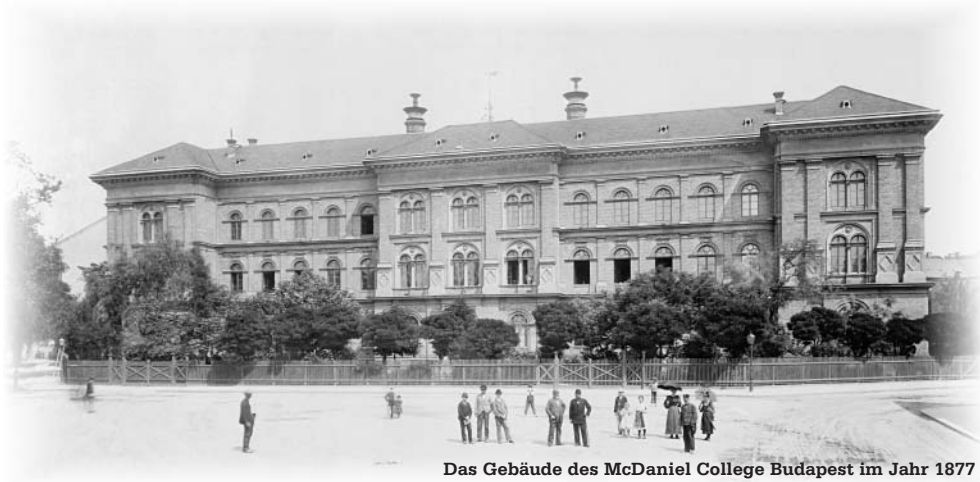
Das Gebäude des McDaniel College Budapest im Jahr 1877